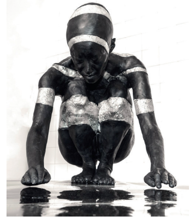
Sara Masüger - Restored Reaction 2016 - Acrylique, étain, époxy, acier 92 x 180 x 67 cm

À la fin de l'année, tu réaliseras une exposition avec les plus belles œuvres que tu auras réalisées !