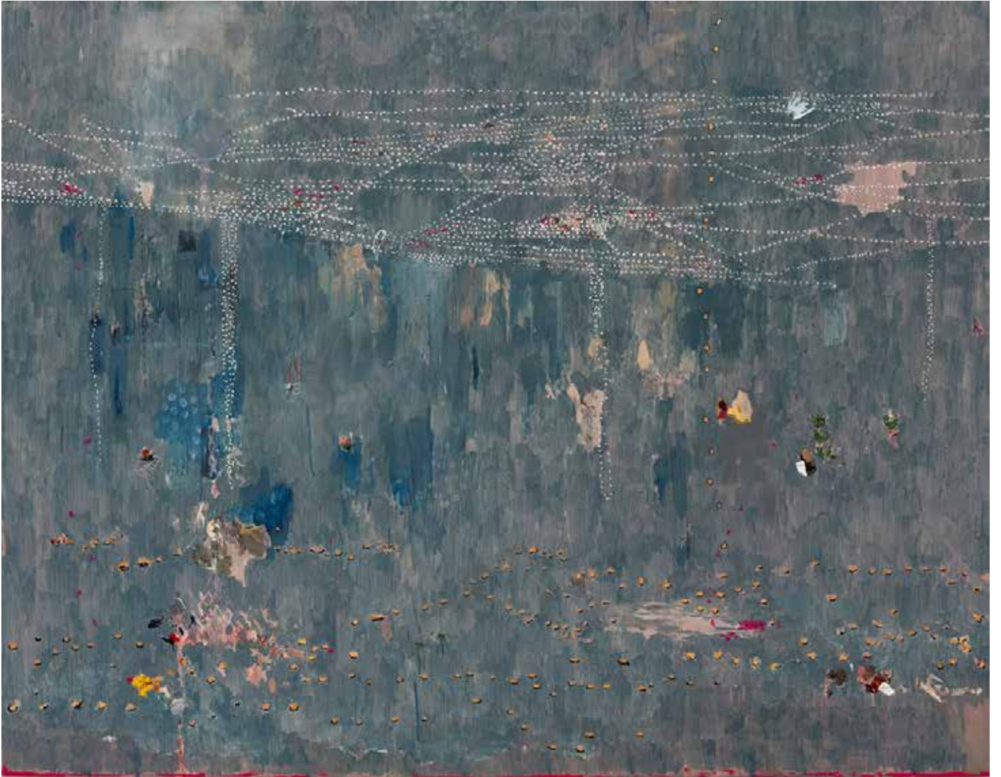
Véu - 2019 - Huile sur toile - 180 x 230 cm - Collection privée, Belgique