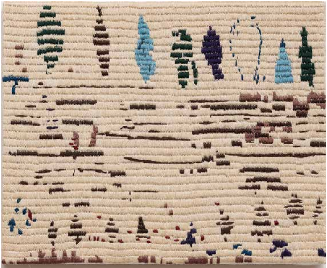
Metamorfose - 2020 - Broderie - 22 x 27 cm