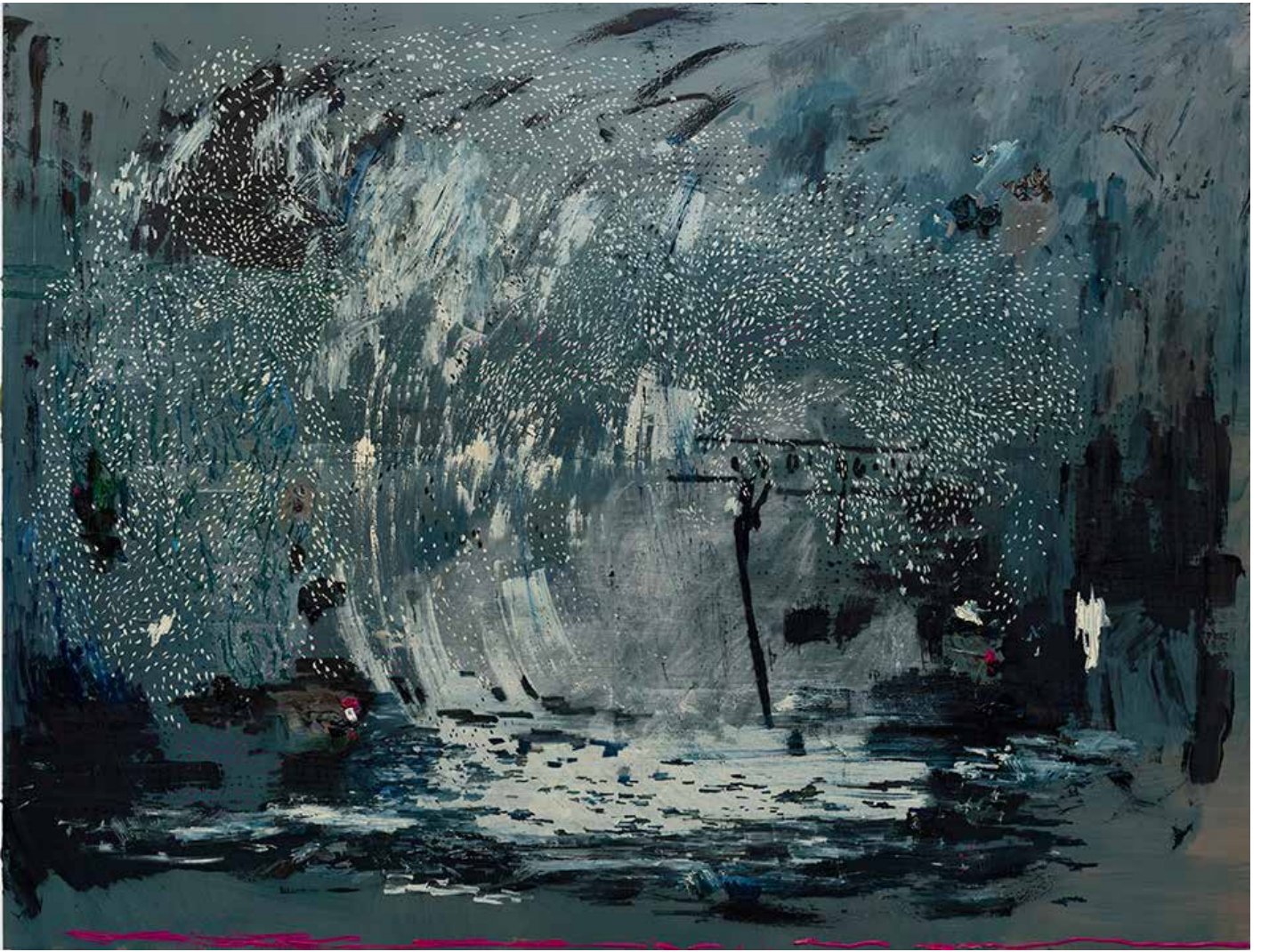
Starlight - 2020 - Huile sur toile - 160 x 210 cm - Collection FRAC Auvergne