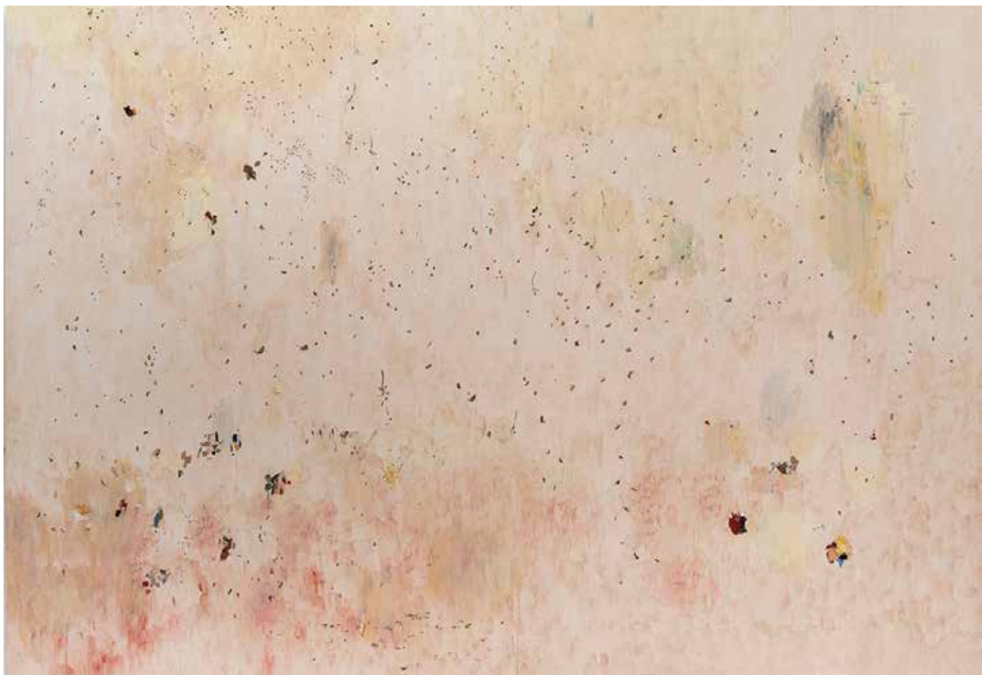
Aurora - 2020 - Huile sur toile - 240 x 350 cm