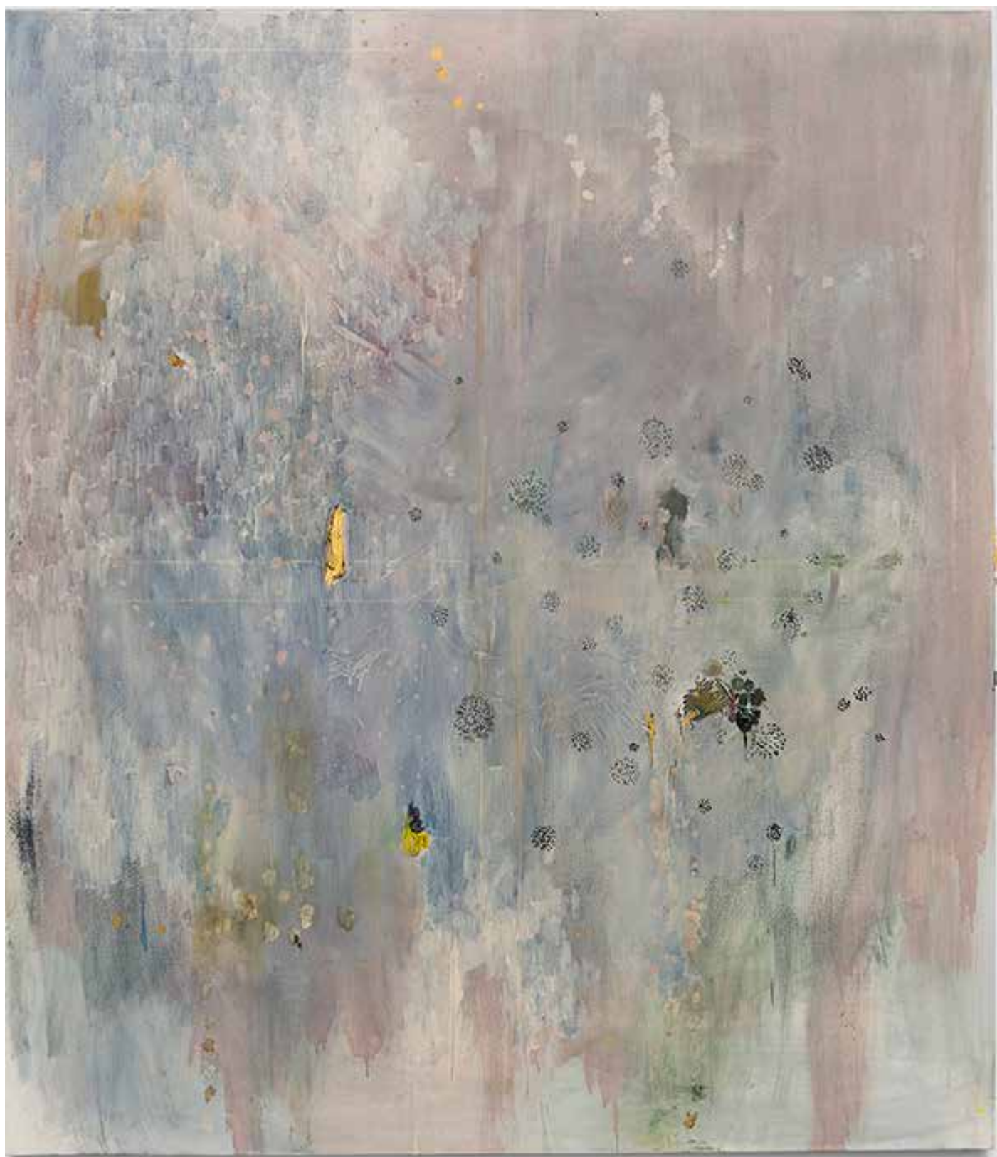
Couverture : Noturno em Si Maior - 2019 - Huile sur toile - 230x330 cm - Collection Musée Voorlinden, Wassenaar, Pays-Bas Ci-dessus : Maretak - 2019 - Huile sur toile - 150x130 cm - Courtesy Galerie Zeno X, Belgique