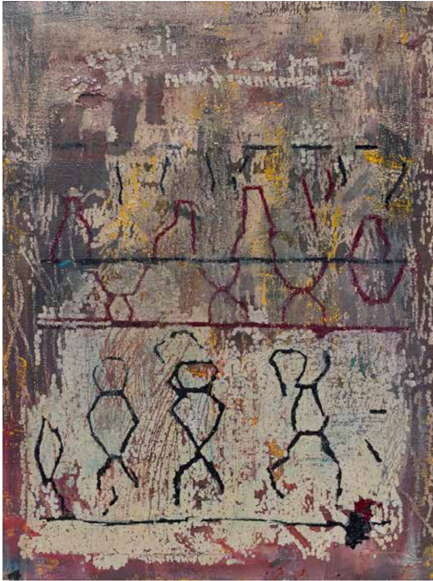
DNA - 2020 - Huile sur lin - 81 x 60,5 cm